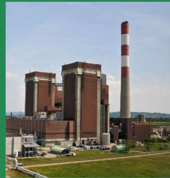
Gestione centrali termiche