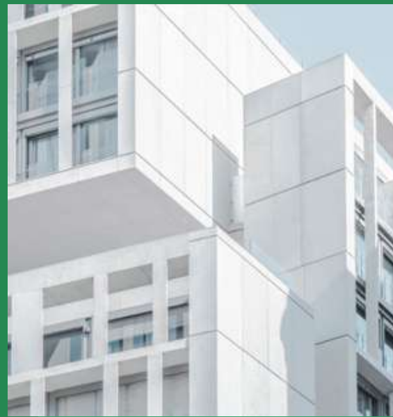
Property & Asset Management