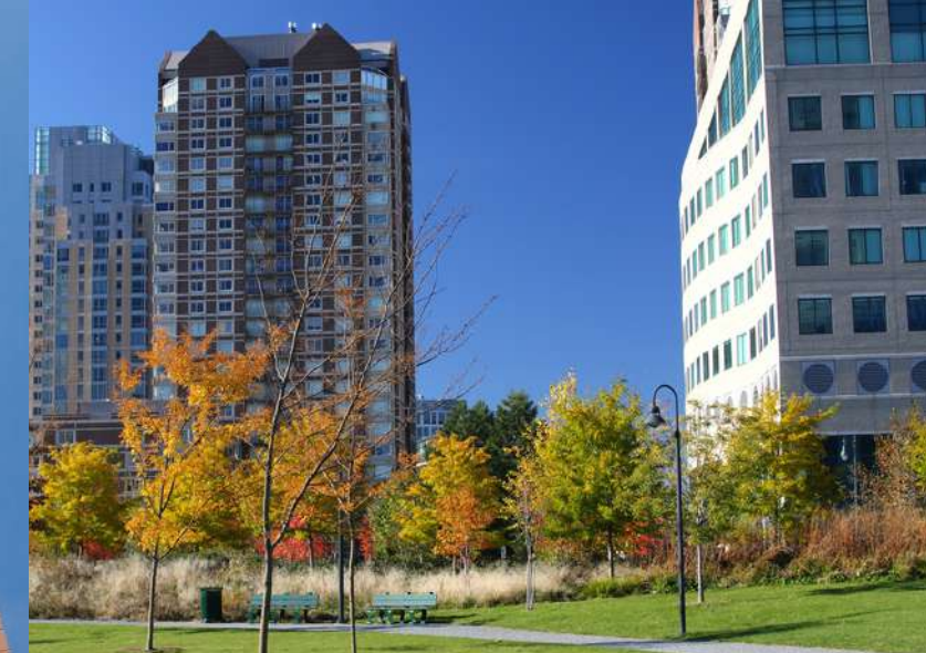
SUPER CONDOMINI E COMPARTI