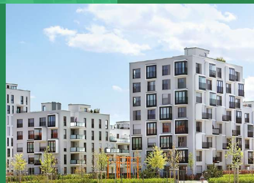
GRANDI COMPLESSI RESIDENZIALI