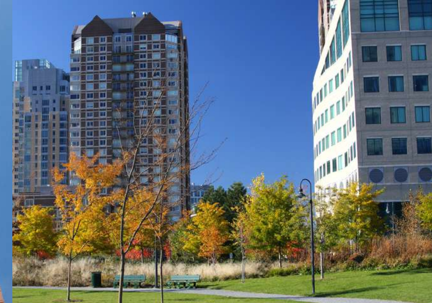
SUPER CONDOMINI E COMPARTI