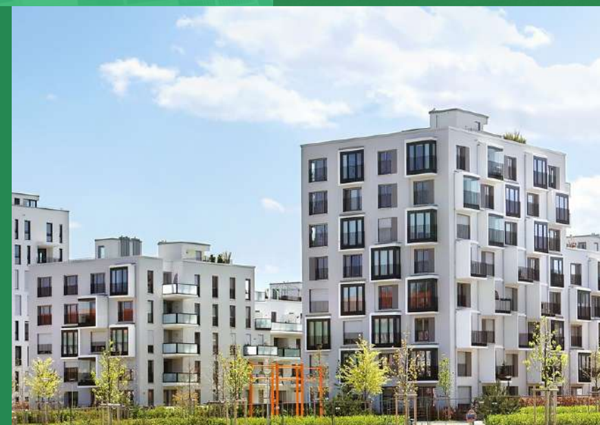
GRANDI COMPLESSI RESIDENZIALI